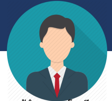
ผู้อำนวยการโรงเรียน